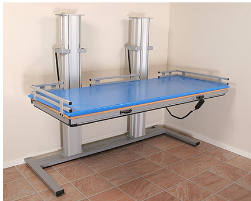
341PL 200 mit Zweifachsäule. Hubkraft 120 kg.