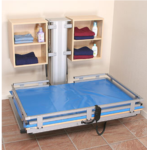
341 PL 120 mit Einzelsäule. Max Hubkraft 80 kg